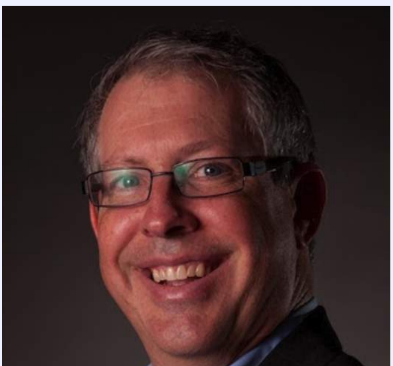
Investigador científico principal

Aprendizaje de la fuerza laboral de J-WEL Profesor titular | MIT Sloan School of Management