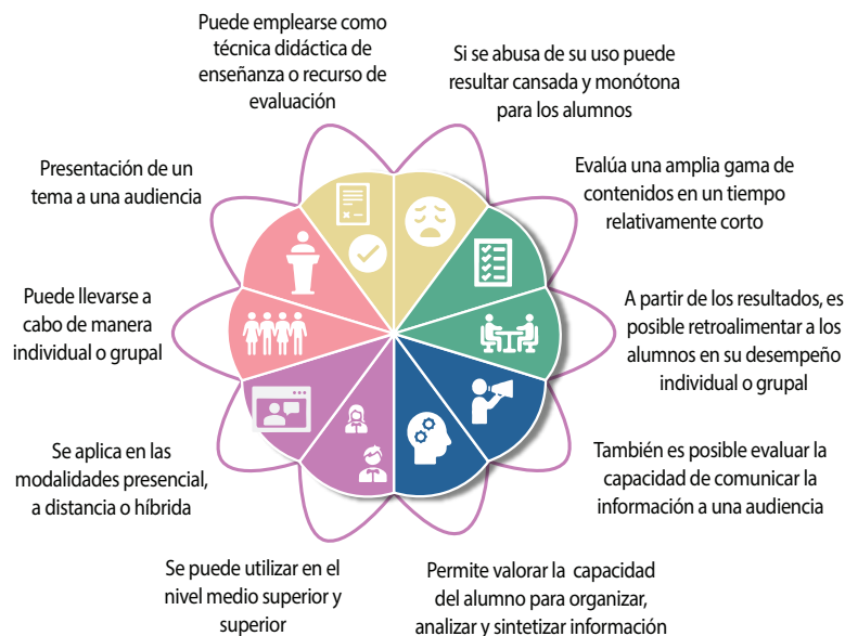
Figura 1. ¿Qué es la exposición oral?